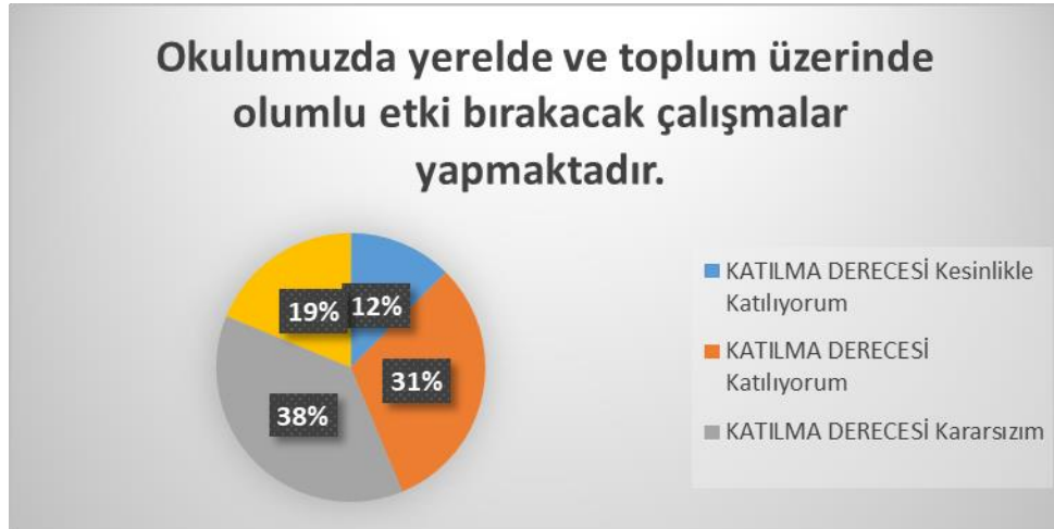
Şekil 4: Toplum Yararlı Çalışma Düzeyi

“Okulumuzda alınan kararlar, çalışanların katılımıyla alınır” sorusuna ankete katılan öğretmenlerin %50’si Katılıyorum yönünde görüş belirtmişlerdir.