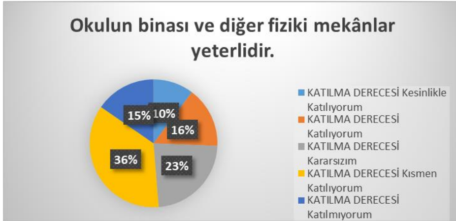
Şekil 6: Okul binasının Yeterlilik Seviyesi

“İhtiyaç duyduğumda okul çalışanlarıyla rahatlıkla görüşebiliyorum” sorusuna ankete katılmış olan velilerin %50’si Katılıyorum yönünde görüş belirtmişlerdir.