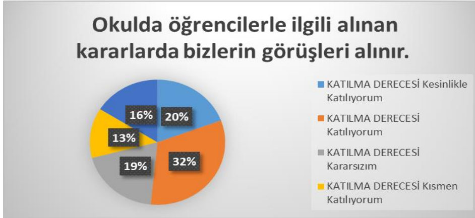
Şekil 1: Öğrencilerle ilgili alınan kararlar

Okulumuzda toplam 439 öğrenci öğrenim görmektedir. Örneklem seçim yöntemine göre seçilmiş toplam 44 öğrenciye uygulanan anket sonuçları aşağıda yer almaktadır.