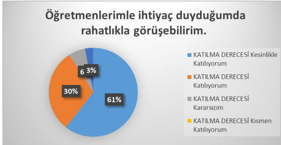
Şekil 2: Öğrencilerin Ulaşılabilirlik Düzeyi

“Okulda öğrencilerle ilgili alınan kararlarda bizlerin görüşleri alınır” sorusuna ankete katılan öğrencilerin %32 Katılıyorum yönünde görüş belirtmişlerdir.