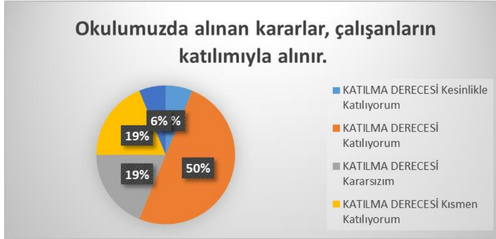
Şekil 3: Alınan Kararlara Katılım Düzeyi

Okulumuzda görev yapmakta olan toplam 21 öğretmenin tamamına uygulanan anket sonuçları aşağıda yer almaktadır.