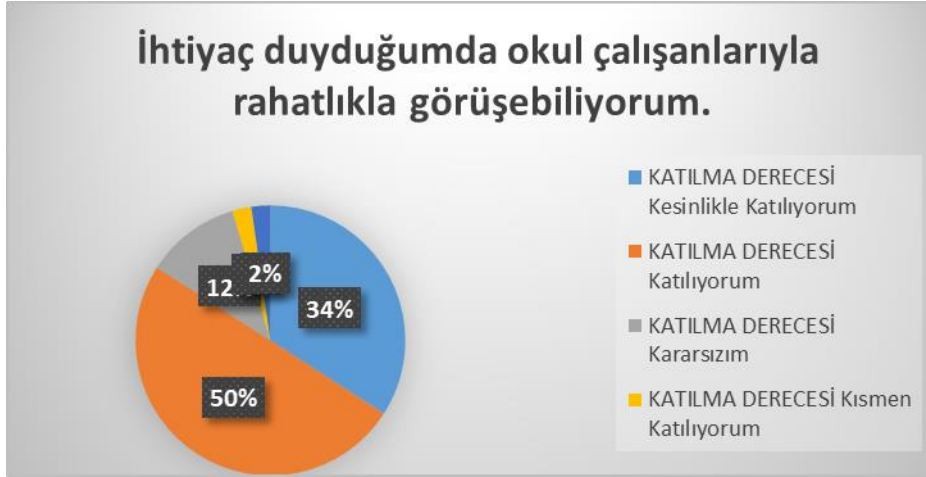
Şekil 5: Velilerin Ulaşılma Seviyesi

439 veli içerisinde Örneklem seçimi Yöntemine göre 68 kişi seçilmiştir. Okulumuzda öğrenim gören öğrencilerin velilerine yönelik gerçekleştirilmiş olan anket çalışması sonuçları aşağıdaki gibidir.